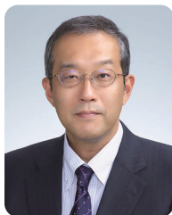
香取 幸夫 東北大学耳鼻咽喉・頭頸部外科 教授

また、患者さまのゲストスピーチも予定しておりますので患者様の立場からみた喉頭摘出後のリハビリテーションの重要性についても考察してまいります。